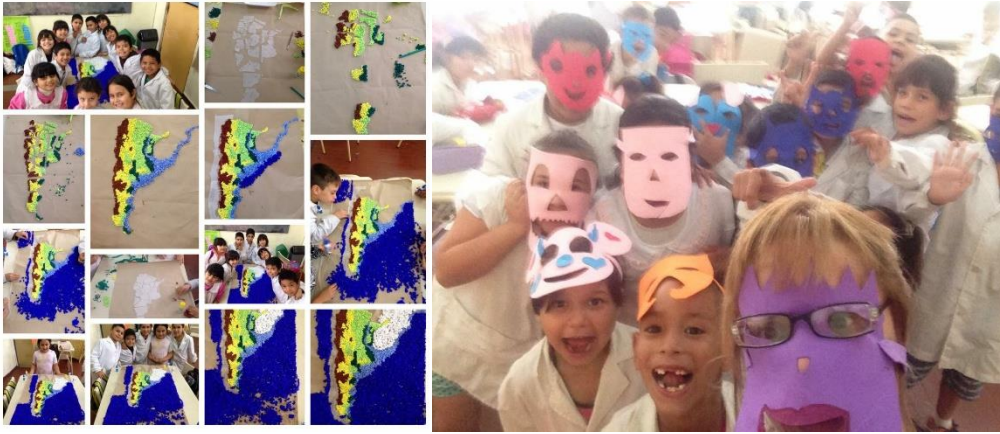
(IMÁGENES BASADAS EN PROYECTOS CON MATERIALES MANIPULATIVOS Y LA HORA DEL DESCANSO QUE PERMITIO MAYOR APRENDIZAJE A LA TARDE, GANANDOLE AL CANSACIO por sobre todo).