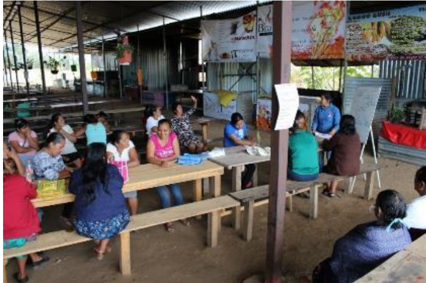
Figura 4.- Sesión 1 taller de pisos con tierra en el Tianguis “Gadoo Gush” San Raymundo Jalpan, Oax.