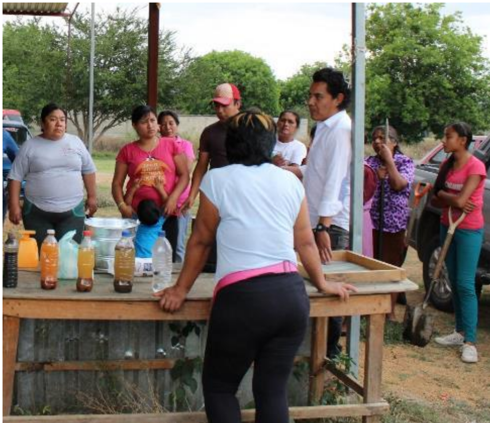
Figura 5.- Participantes del taller constructivo de pisos en la Identificación de materiales y procedimiento constructivo con tierra Tianguis “Gadoo Gush” San Raymundo Jalpan, Oax.