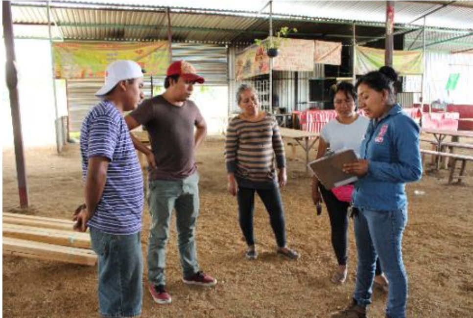
Figura 6.- Participantes del taller constructivo de pisos con tierra in situ. Tianguis "Gadoo Gush" San Raymundo Jalpan, Oax.

2ª.sesión "Transferir tecnología" (8 horas 8/05/2018).