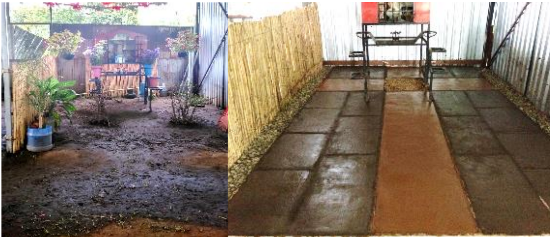
Figura 9.- Vista de la capilla del tianguis “Gadoo Gush”, previo a la intervención constructiva del taller pisos con tierra (a) y Piso terminado en el taller constructivo “Pisos de tierra” (b).