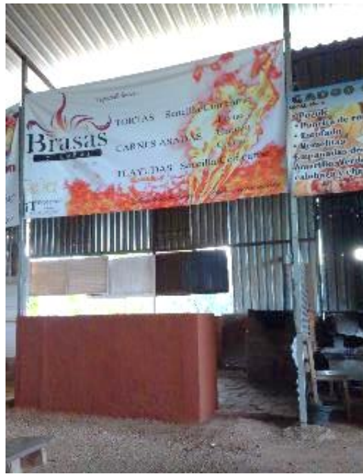
Figuras 1 Vista del local antes de la intervención (a) y con la aplicación de Ecotécnia aplanado con tierra en barra de local (b), Tianguis “Gadoo Gush”, San Raymundo Jalpan, Oax.

En el taller se involucraron los ocho pasos de la metodología para el ciclo de aprendizaje del sistema 4MAT.