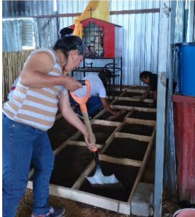
Figura 8.- Participantes del taller en el colado de piso de tierra Tianguis “Gadoo Gush” San Raymundo Jalpan, Oax.