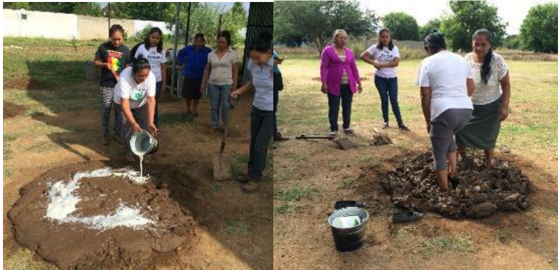
Figura 7.- Transferencia de tecnología mezclas y agregados (a) y Mujeres en la preparación de mezclas para pisos de tierra (b) Tianguis "Gadoo Gush". San Raymundo Jalpan, Oax.

Para la segunda jornada de actividades, se realizó el procedimiento y explicación de la técnica consistente en el conocimiento de la mezcla de tierra y agregados (Figura 7 a y b), se realizó de manera participativa la preparación de la mezcla final, el colado de piso (Figura 8) y los acabados decorativos, logrando finalmente un piso terminado (Figura 9 a y b) y la satisfacción del grupo.