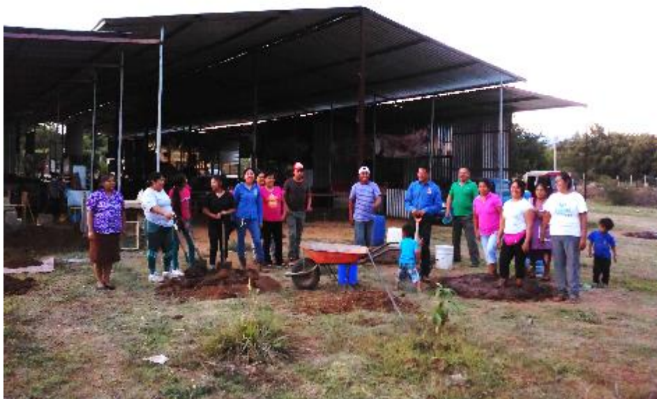
Figura 3.- Participantes del taller de Ecotécnia pisos de tierra en el "Tianguis Gadoo Gush".

En la implementación se realizó un taller de pisos de tierra como primera actividad de apropiación de ecotecnias, tuvo una duración de 12 horas, se elaboró un piso de 11.60 m 2 de superficie, en el área destinada como capilla religiosa dentro del tianguis, participando 21 personas, principalmente integrantes del grupo y 5 facilitadores técnicos entre alumnos y docentes del CIIDIR Oaxaca (Figura 3), así mismo se extendió el aprendizaje en una sesión adicional de 4 horas, con la participación de un locatario, para la aplicación de la técnica en aplanado de muros.