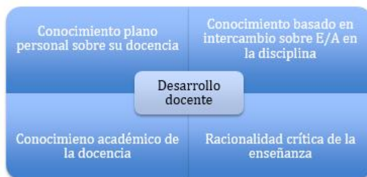
Figura 1. Proceso de profesionalización basado en Weston y McAlpine (2001), Cranton (2011) y (Ossa et al, 2015).

Para el segundo aspecto quisimos evidenciar los lugares que toma el diálogo en la interacción con el profesor, durante el diseño y la implementación de una innovación educativa. Consideramos que los temas del acompañamiento se vuelven promotores de la reflexión, citamos como ejemplo, algunos de los que están presentes en las etapas del diseño basado en la metodología ADDIE, desde la que orientamos procesos de innovación.