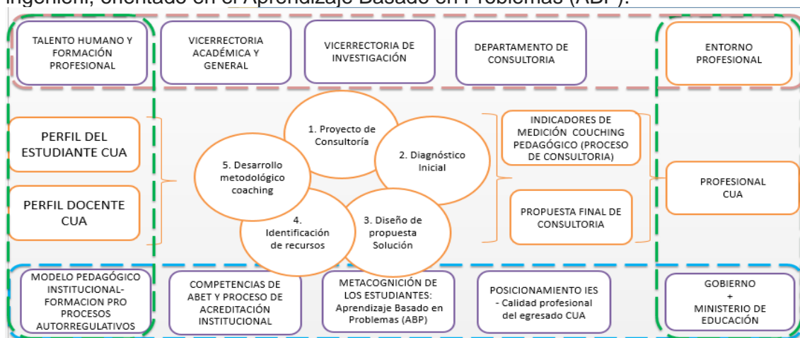
Figura 1. Propuesta de Modelo Coaching pedagógico- Corporación Universitaria Americana (Elaboración propia)

Los resultados obtenidos en la presente investigación son presentados a seguir, con la propuesta y justificación de la estructuración de la propuesta de un modelo de coaching pedagógico para la Corporación Universitaria Americana, sede Medellín, vinculando los principales elementos que intervienen en el proceso de consultoría ingenieril, orientado en el Aprendizaje Basado en Problemas (ABP).