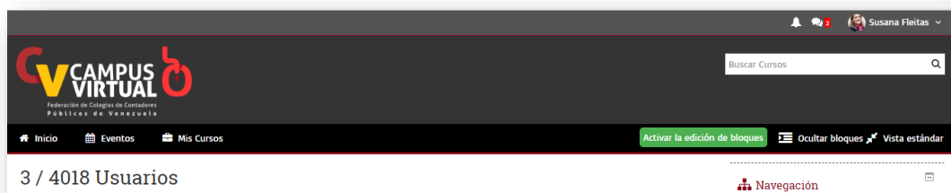
Imagen 1 Usuarios registrados en el Campus Virtual FCCPV

En el Campus Virtual se habilitó un área de verificación en línea de los certificados digitales donde con código QR los receptores de los certificados emitidos pueden verificar la autenticidad de la emisión, como se demuestra en la Imagen N° 2 y N° 3.