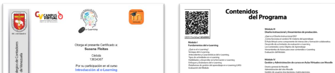
Imagen 2 Modelo de Certificados digitales

En el Campus Virtual se habilitó un área de verificación en línea de los certificados digitales donde con código QR los receptores de los certificados emitidos pueden verificar la autenticidad de la emisión, como se demuestra en la Imagen N° 2 y N° 3.