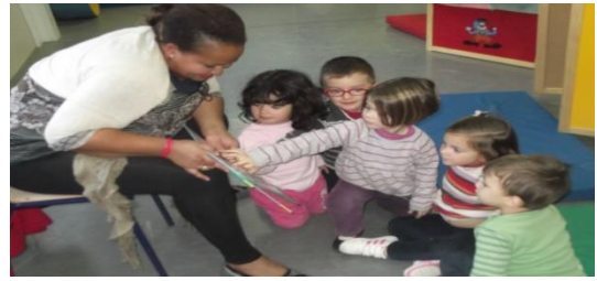
Figura 4. Cuentacuentos.