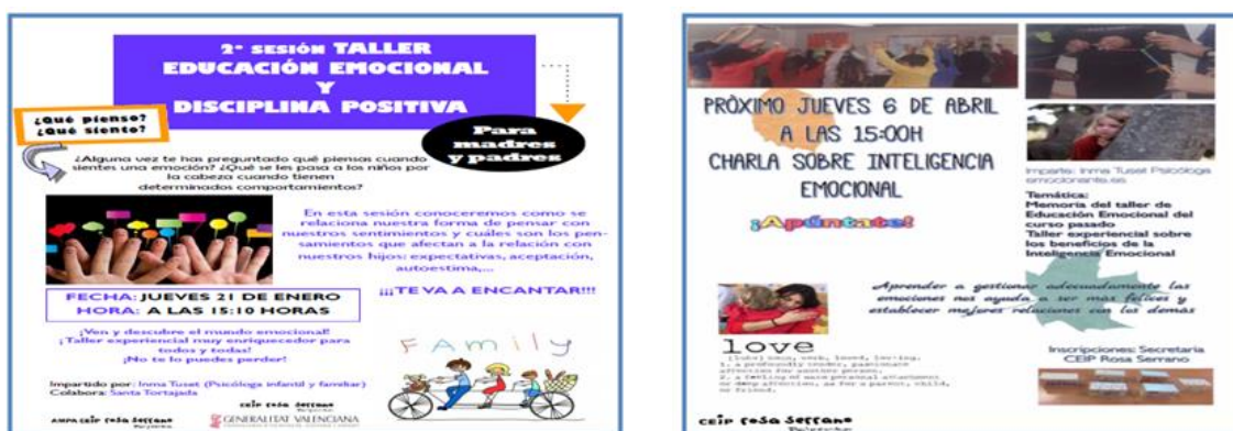
Figura 8. Talleres de educación emocional y disciplina positiva.