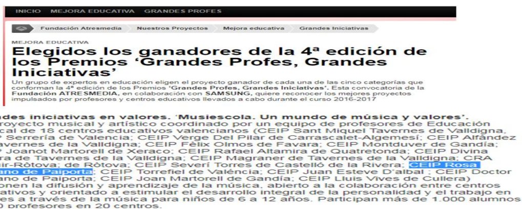
Figura 10. Premio ATRESMEDIA.