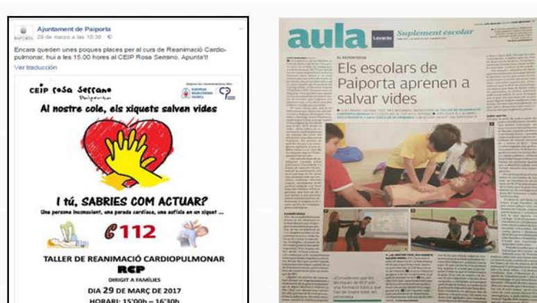
Figura 7. Proyecto RCP