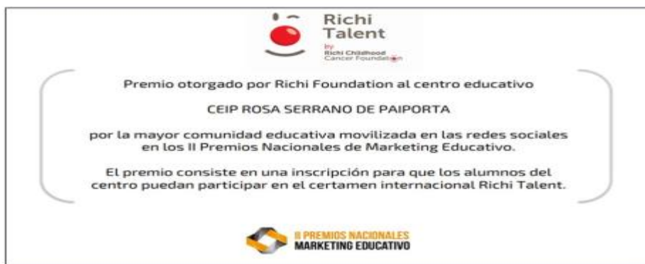
Figura 11. Premio a la mayor comunidad educativa movilizada en redes sociales.

Por todos estos motivos, se debe abrir el centro educativo a la comunidad y al contexto de referencia, lo que implica relaciones no sólo con las familias, sino también con los demás agentes educativos, dando así respuesta a las demandas sociales y educativas actuales (Aguado, Buendía, Marín & Soriano, 2006). De esta manera, se consigue minimizar los problemas de convivencia y potenciar la unidad como escuela, lo que contribuye a que la calidad de la escuela aumente (Bolívar, 2006) a la vez que permite enriquecerla con las aportaciones de todos. En definitiva, el éxito de experiencias educativas como esta muestra la posibilidad de transformar tanto el centro escolar como el entorno próximo, consiguiendo una mayor atención individualizada y con ello una mayor cohesión social. Por todo ello, familia, escuela y comunidad son tres esferas que según el grado en el que compartan intersecciones y se solapen tendrán sus efectos en la educación del alumnado (Epstein, 2011). La colaboración entre estos agentes educativos es un factor clave en la mejora de la educación y con ello de la inclusión. Destacando que esto se consigue a través de proyectos con estructuras flexibles y abiertas, de tal manera que el aprendizaje se convierte en un modelo social, consiguiendo que la educación sea una cuestión de toda la sociedad (Pérez-Barco, 2013).