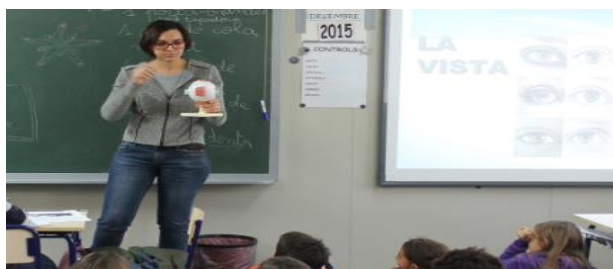
Figura 6. Proyecto Visión.