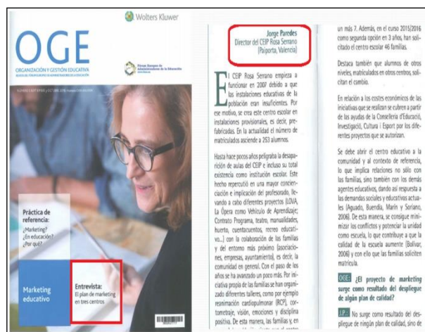
Figura 9. Revista Organización y Gestión Educativa.