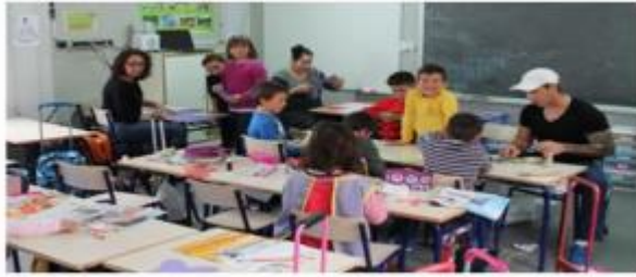
Figura 3. Talleres de manualidades.