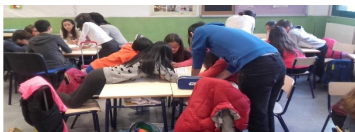
Figura 2. Grupos interactivos.