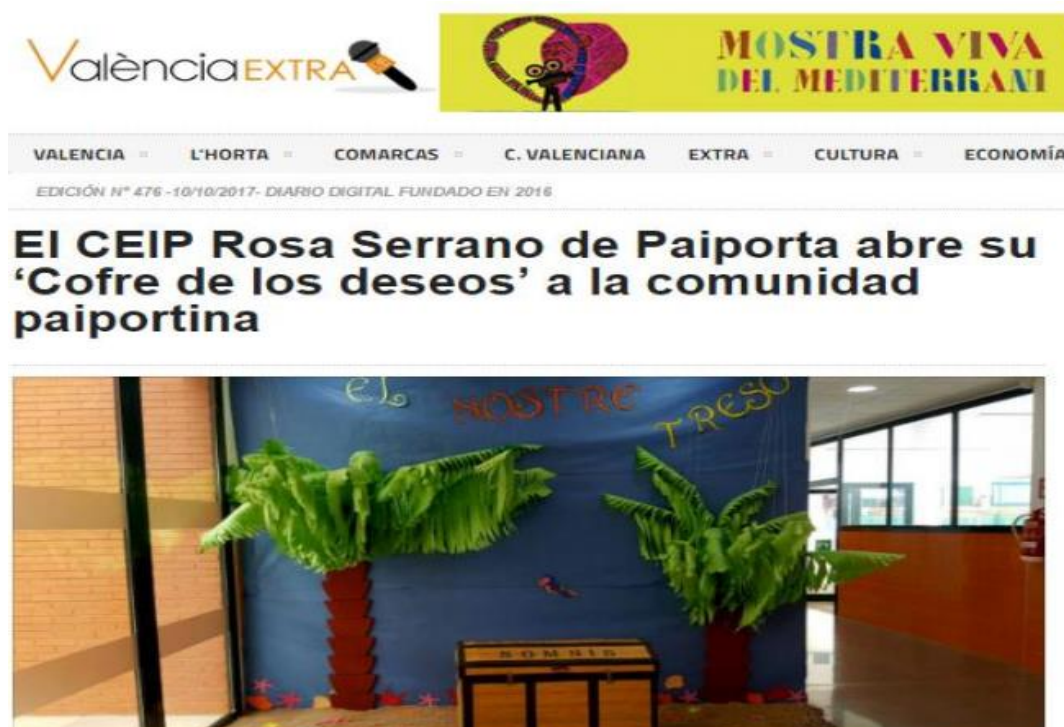
Figura 1. El Cofre de los deseos.

Y ¿cómo se conseguía esto? Escuchando que pensaba y sentía toda la Comunidad Educativa a través del Cofre de los Deseos (ver Figura 1 ). Con esta iniciativa se consiguió que entre todos se compartieran propuestas, ideas e iniciativas con el objetivo de dar respuesta a nuevos retos que transformaran nuestra realidad (destino del centro) hacia un proyecto común que promoviera la participación, el compromiso y el diálogo. Todas las propuestas recogidas fueron sopesadas en una comisión mixta formada por madres, padres, AMPA, docentes y alumnado con el fin de valorar y ver cuáles eran posibles de llevar a cabo.