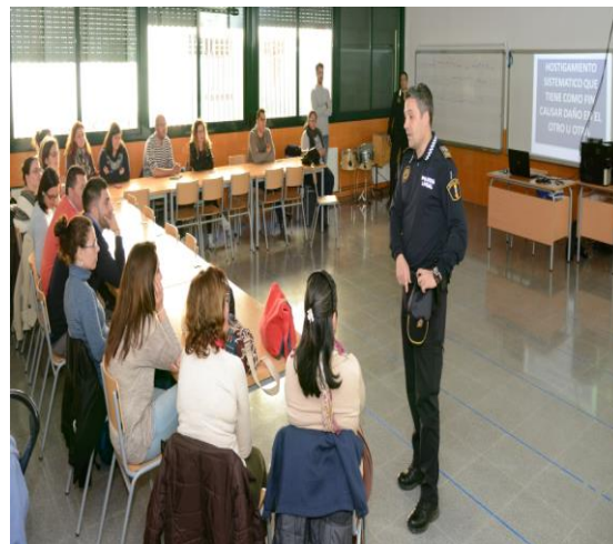
Figura 9. Talleres Escuela para tod@s.

Así como también talleres que consiguieran mejorar los vínculos de amistad dentro de las familias. Un ejemplo es el taller de risoterapia