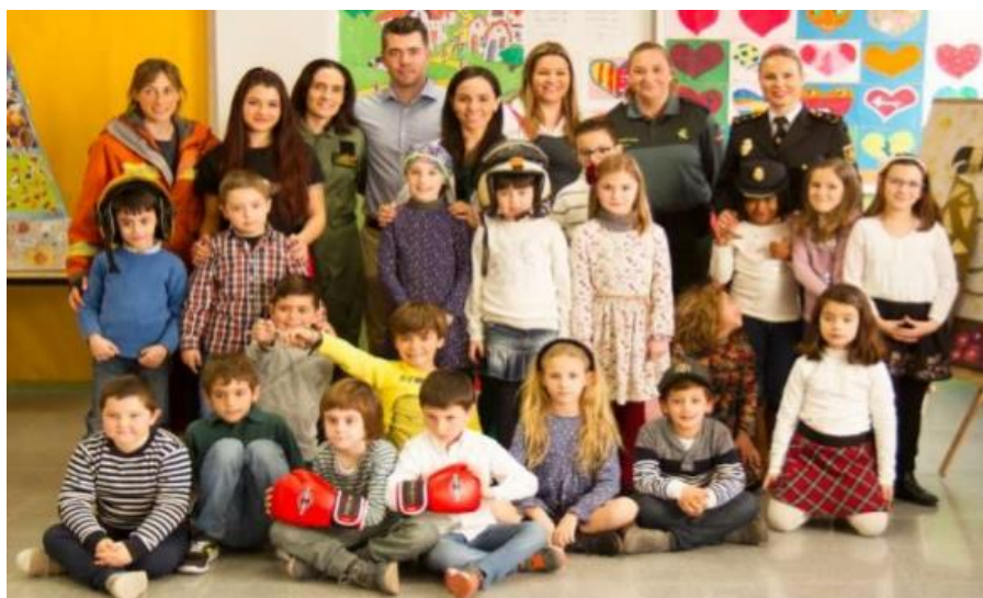
Figura 6. Educando en igualdad.

Otro programa que hemos llevado a cabo en el centro con el objetivo de mejorar la convivencia son las dinámicas de grupo . De este modo, el profesorado dinamizaba la construcción de la convivencia positiva y el desarrollo sociomoral del alumnado. Con esta estrategia hemos pretendido abordar los problemas que afectan al grupo-clase desde un enfoque de participación democrático, puesto que el aula es una herramienta indispensable en un plan de convivencia escolar. También, con este programa, se promueve el conocimiento del alumnado entre sí, potenciando la interacción multidireccional, amistosa, positiva y constructiva. Por ello se mejoraba las habilidades de comunicación, lo que incrementaba la emisión de mensajes que potenciaban un autoconcepto positivo. Además, se afianzaba las conductas de sensibilidad social o conductas de colaboración en relación a los compañeros/as con más dificultades e incrementaba las conductas asertivas disminuyendo las conductas pasivas y agresivas.