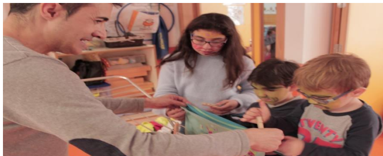
Figura 8. Talleres coeducativos.

Además como hemos dicho anteriormente se buscaba la participación de toda la Comunidad Educativa (participación bidireccional y horizontal) con el objetivo de mejorar las relaciones interpersonales, a la vez que se concienciaba a toda la sociedad de la importancia de la coeducación. Por ello se realizaron diferentes talleres durante el curso escolar. Destacando un taller coeducativo que consistía en inducir tanto a familias como alumnado a la reflexión y a la crítica sobre algunas tareas que en ocasiones generan discriminación entre las personas por el simple hecho de pertenecer a sexos diferentes. Con esta actividad incidimos en los dos principales pilares que constituye el centro escolar junto al profesorado como son las familias y el alumnado. En este taller de manera conjunta se realizaron diferentes actividades que se llevan a cabo en el día a día en nuestros hogares como son: planchar, tender, lavar, cocinar, maquillar y peinar, etc. (ver Figura 8).