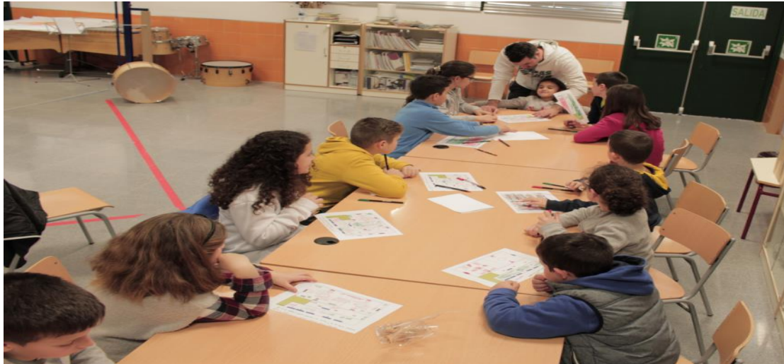
Figura 2. Junta de delegados.

En ella se valoraba todos aquellos aspectos que consideraran necesarios. Uno de los primeros aspectos que se analizaron era el recreo que en el cofre de los deseos se pedía que fuera un espacio en el que hubiera menos conflictos. Por esa razón, el profesorado era sabedor que los conflictos no iban a dejar de existir ya que son inherentes y consustanciales a la persona (Arellano, 2007; Pino & García, 2007; Viñas, 2004). Pero si se podía dar herramientas al alumnado para poder resolverlos de forma dialogante y positiva (Ortega, 2010). Para ello, lo primero era que el alumnado analizara este espacio y comprobara si todo el alumnado tenía las mismas posibilidades de jugar (ver Figura 3 ). Este análisis demostró que no todo el alumnado disponía de las mismas opciones de disfrutar de este tiempo de ocio ya que existía monopolización de los “chicos mayores” de la pista central para jugar a fútbol (el color rojo indicaba la zona que utilizaban los chicos y el color verde el espacio de las chicas) lo que generaba actitudes sexistas, agresividad, sedentarismo, etc.