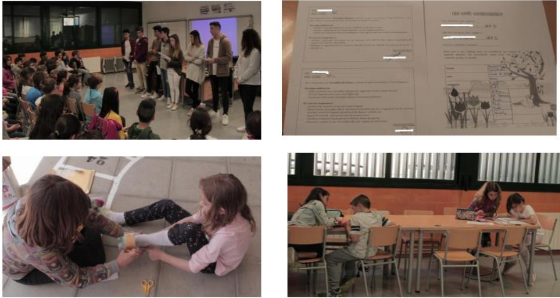
Figura 7. Proyecto Germ@mic.

Además como hemos dicho anteriormente se buscaba la participación de toda la Comunidad Educativa (participación bidireccional y horizontal) con el objetivo de mejorar las relaciones interpersonales, a la vez que se concienciaba a toda la sociedad de la importancia de la coeducación. Por ello se realizaron diferentes talleres durante el curso escolar. Destacando un taller coeducativo que consistía en inducir tanto a familias como alumnado a la reflexión y a la crítica sobre algunas tareas que en ocasiones generan discriminación entre las personas por el simple hecho de pertenecer a sexos diferentes. Con esta actividad incidimos en los dos principales pilares que constituye el centro escolar junto al profesorado como son las familias y el alumnado. En este taller de manera conjunta se realizaron diferentes actividades que se llevan a cabo en el día a día en nuestros hogares como son: planchar, tender, lavar, cocinar, maquillar y peinar, etc. (ver Figura 8).