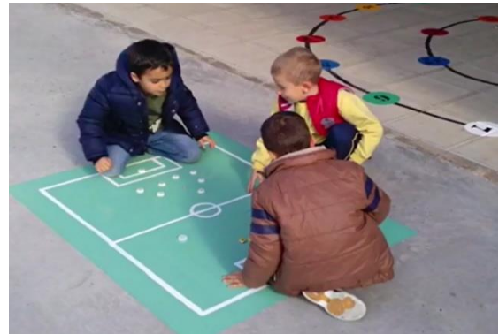
Figura 5. Recreo Activo.

También se han realizado actividades para romper con los estereotipos sexuales a nivel laboral y deportivo. Por ejemplo el taller de “Educando en igualdad” en el que se buscaba que niñas y niños pensarán en un futuro sin estereotipos, donde puedan elegir cualquier profesión independientemente de que se hayan asociado tradicionalmente al género masculino (ver figura 6) https://youtu.be/RoDpCckFc4c