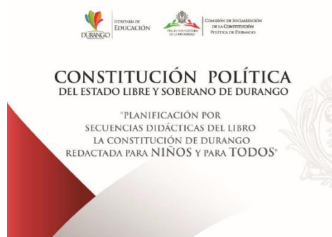
Figura 3: Portada de las Planeaciones entregada a los docentes frente a grupo

Una vez que las planeaciones fueron terminadas y validadas por el equipo, se socializaron con las autoridades de educación secundaria, quienes, con el apoyo de los Jefes de Enseñanza, realizaron sugerencias de algunos cambios. Finalmente, en la etapa de la prueba piloto, los maestros aportaron ideas importantes que orientaron los ajustes quedando la portada tal como se presenta en la figura 3