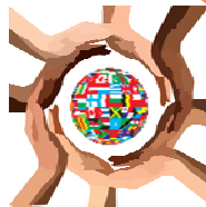
Congreso internacional sobre Educación y Formación Ambiental (Mosú 1987)

"Desarrollo sostenible es el desarrollo que satisface las necesidades de la generación presente, sin comprometer la capacidad de las generaciones futura de satisfacer sus necesidades propias"