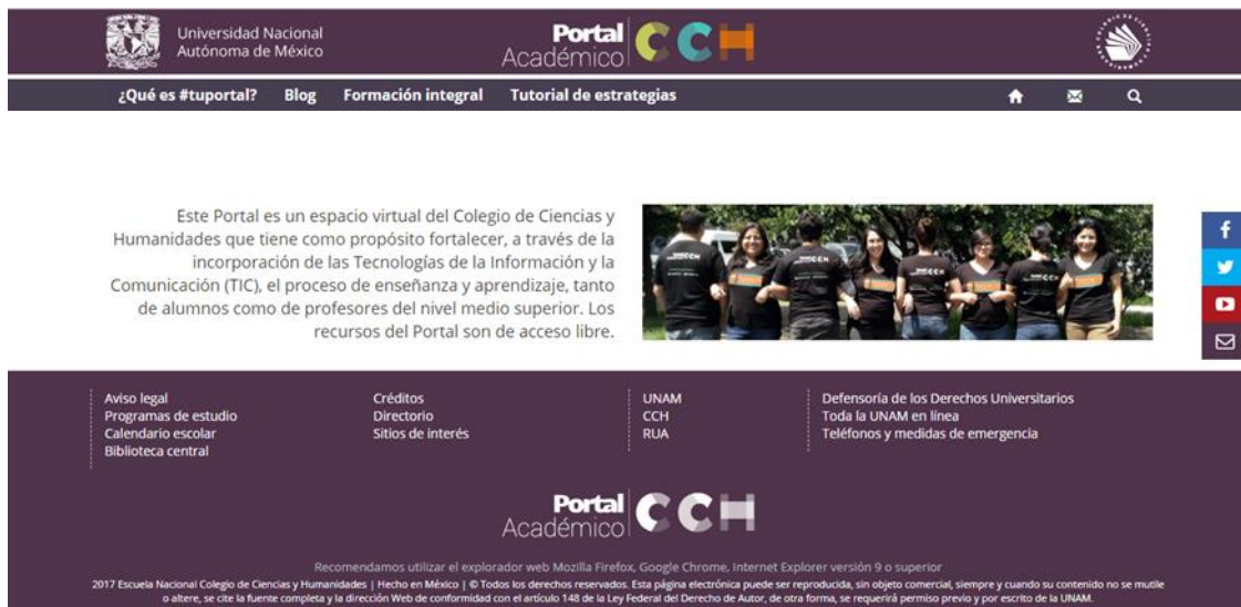
Figura 2. Composición de diferentes elementos del Portal Académico del Colegio de Ciencias y Humanidades de la Universidad Nacional Autónoma de México.

Un ejemplo es el Portal Académico del Colegio de Ciencias y Humanidades de la Universidad Nacional Autónoma de México, el cual se diseñó para apoyar a los estudiantes a través de la inclusión de recursos didácticos que apoyan el proceso de enseñanza-aprendizaje de diversas asignaturas del plan de estudios (Figura 2).