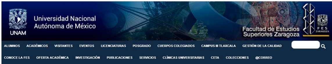
Figura 1. Encabezado del Portal de la Facultad de Estudios Superiores Zaragoza de la Universidad Nacional Autónoma de México.

Los segundos, sin embargo, van dirigidos a un segmento específico, estudiantes y profesores, que participan de uno o varios temas o asignaturas académicas. Su característica principal es la de contribuir al proceso de enseñanza-aprendizaje de uno o varios contenidos de un currículo escolar a través de la inclusión de una variedad de recursos y actividades, las cuales se presentan en diferentes formatos: texto, audio, video e imagen fija.