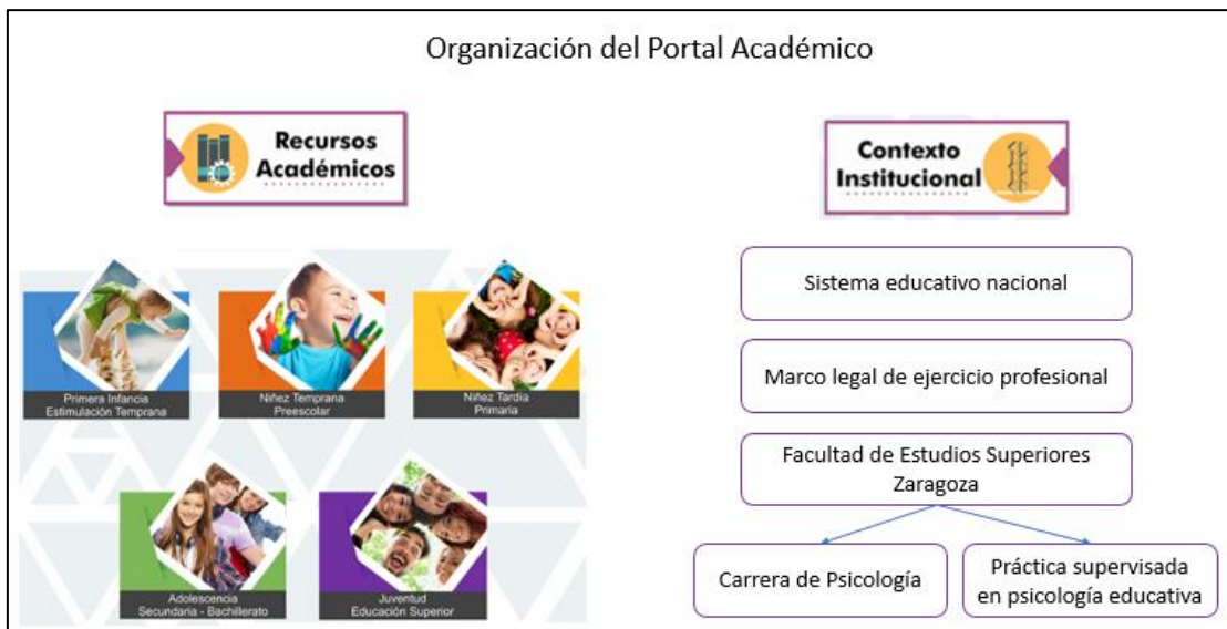
Figura 4. Organización del portal académico.

alguno de los cinco temas principales, dependiendo del programa que se lleve a cabo en Práctica Supervisada y, siguiendo la ruta de su interés, consulta los recursos disponibles.