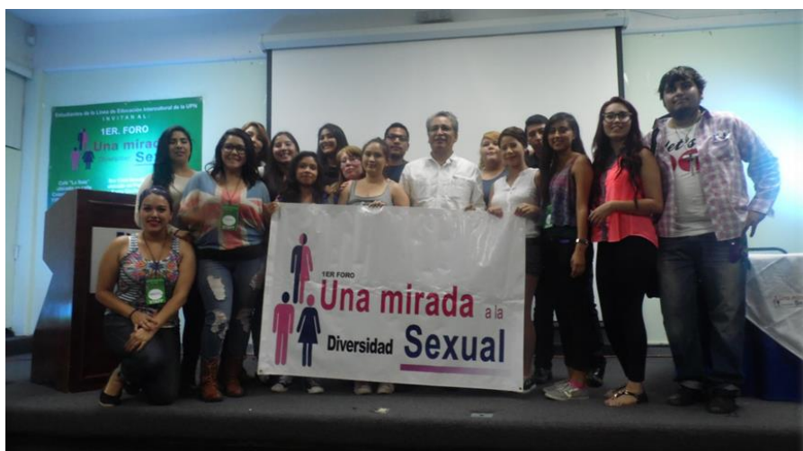
Imagen No. 1

Consientes que el proceso formativo no se realiza únicamente en las aulas, decidimos realizar el evento en tres espacios diferentes durante los tres días programados, el primero de ellos fue un café, espacio que en los últimos años ha adquirido popularidad entre las y los jóvenes, el segundo fue un “bar gay” en el centro de la ciudad, reconocido por ser uno de los más antiguos en Tijuana, el cierre se propuso en las instalaciones de la Universidad. Sin embargo, un segundo interés de hacerlo en esos espacios era el que continuaran funcionando “normalmente” mientras se realizaba el Foro. VIVIENDO VIH